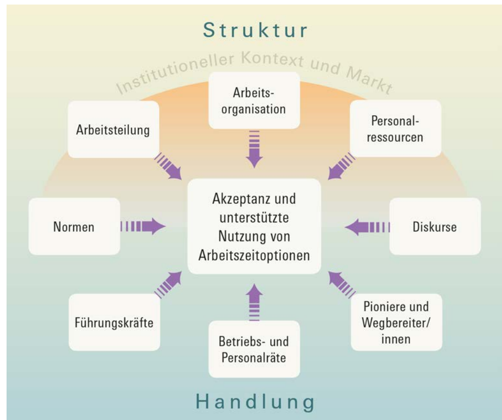
Abbildung 1 Betriebliche Faktoren für die Akzeptanz und unterstützte Nutzung von Arbeitszeioptionen

Einen Überblick über die Faktoren auf betrieblicher Ebene gibt Abbildung 1: